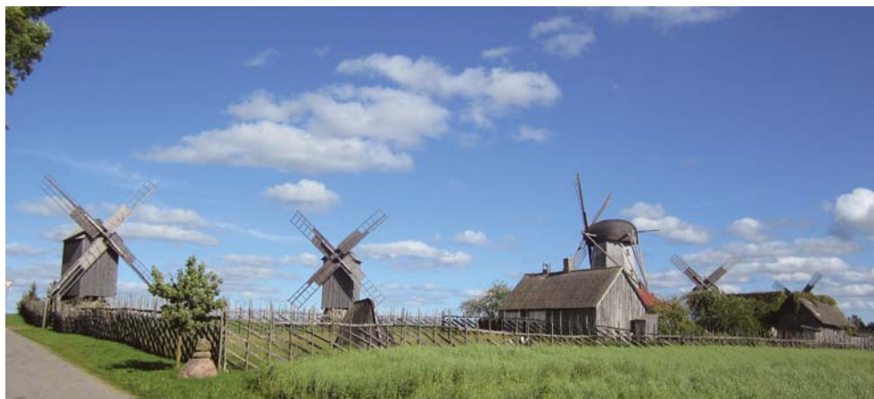
■ Die 5 Windmühlen von Angla sind die letzte erhaltene Windmühlengruppe auf Saaremaa. / 5 wiatraków in Angla, ostatnia zachowana grupa wiatraków na wyspie Saaremaa.