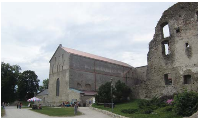
■ Die Bischofskirche in der Burgruine von Haapsalu. / Katedra w ruinach zamku w Haapsalu.

Polsko-niemiecko-estońskie spotkanie studyjne w dniach 07.08.–15.08.2024